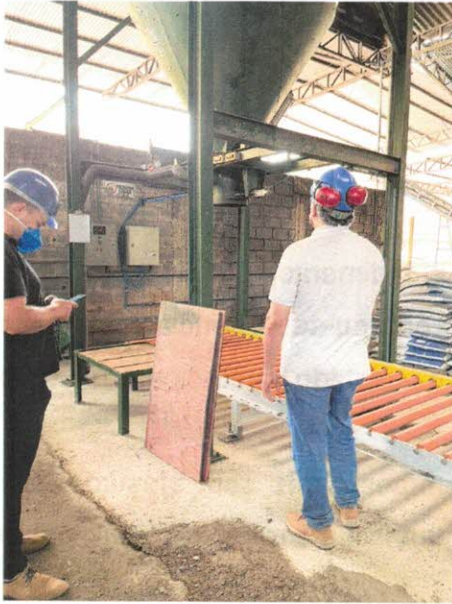
FOTO 3: Execução de piso de alta resistência com polimento mecânico

Secretaria Municipal de Administração Divisão de Engenharia