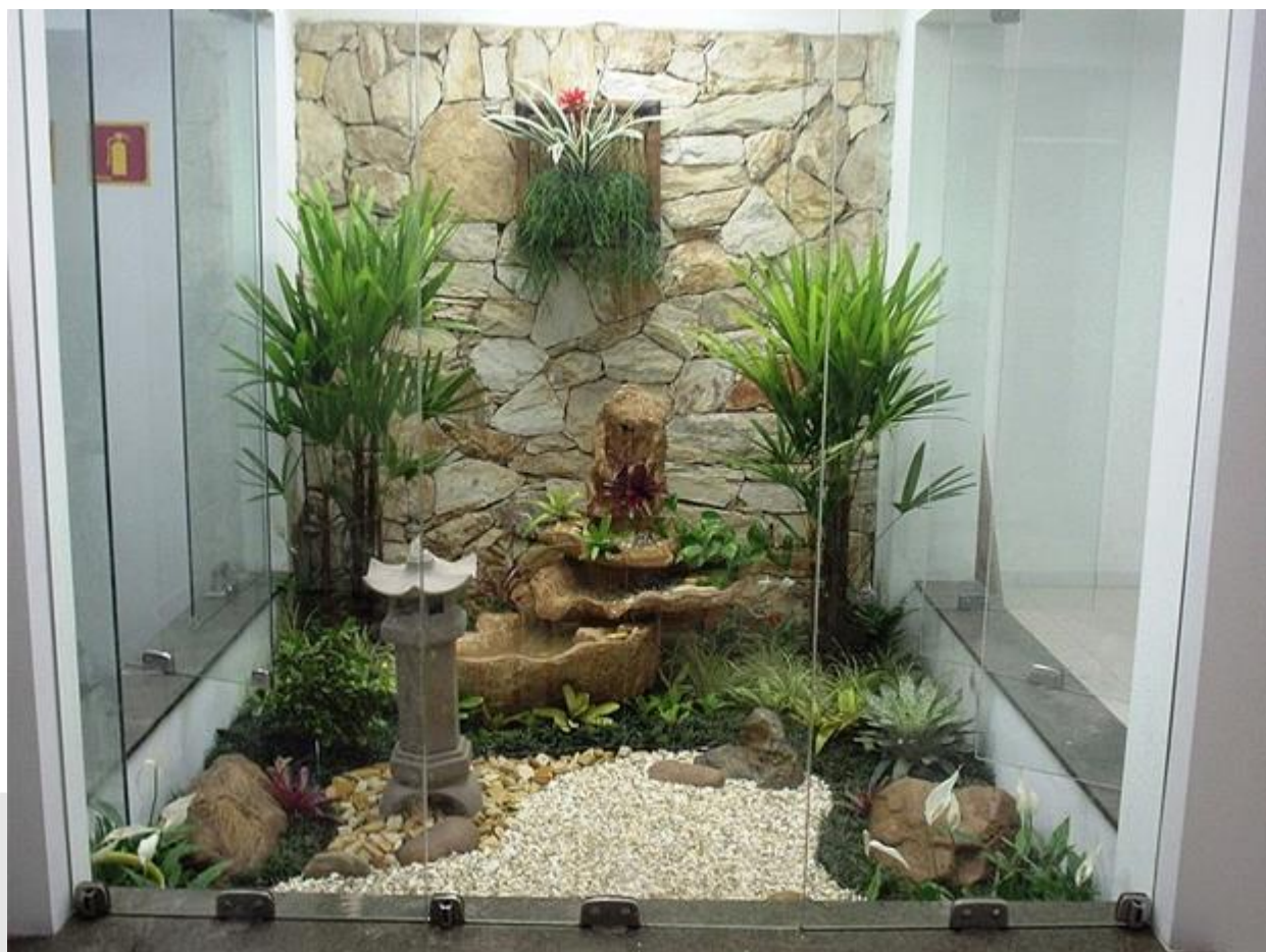
Figura 1: Foto demonstrativa do Jardim de inverno.