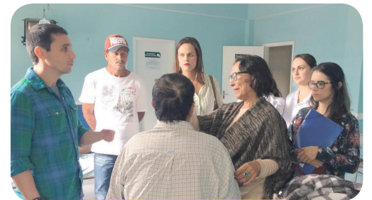
COMBATE AO SURTO DE LEISHMANIOSE EM PARCERIA COM A FIOCRUZ, MINISTÉRIO DA SAÚDE E SESA. ATENDIMENTO JUNTO À POPULAÇÃO.