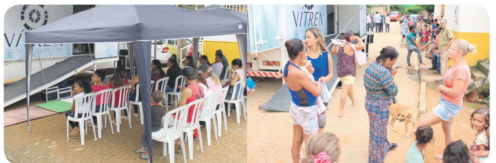
MUTIRÃO DE OFTALMOLOGIA: QUATRO AÇÕES NO CENTRO E PELA PRIMEIRA VEZ EM CRICIÚMA E SANTA CLARA. MAIS DE 300 CONSULTAS.