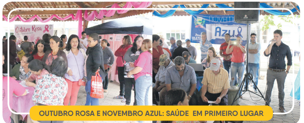
OUTUBRO ROSA E NOVEMBRO AZUL: SAÚDE EM PRIMEIRO LUGAR

Também de forma inédita, estão sendo oferecidos mais de 120 consultas de Urologia por mês, às terças-feiras. Agora, os homens de Ibatiba não precisam buscar esse atendimento em outras cidades.