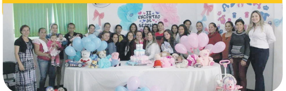
ACOMPANHAMENTO E ACOLHIMENTO DA MAMÃE E DO BEBÊ NOS PRIMEIROS DOIS ANOS DE VIDA