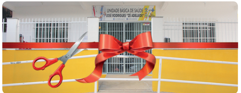
REFORMA E AMPLIAÇÃO DA UNIDADE DE SAÚDE BÁSICA JOSÉ ADELAIDE RODRIGUES "ZÉ ADELAIDE" NA COMUNIDADE DE SANTA CLARA. OBRA QUE ESTAVA ABANDONADA PELA GESTÃO ANTERIOR.