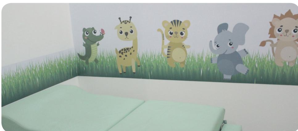
NOVA SALA DE VACINA MAIS ACONCHEGANTE PARA VACINAÇÃO DE CRIANÇAS.

MAIS EXAMES, MAIS MÉDICOS E NOVOS EQUIPAMENTOS PARA ATENDER A POPULAÇÃO DE IBATIBA.