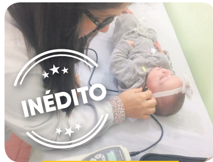
TESTE DA ORELHINHA EM RECÉM-NASCIDOS.

OS EQUIPAMENTOS ERAM ESPERADOS HÁ DÉCADAS PELOS SERVIDORES E ESTÃO GARANTINDO MAIS SEGURANÇA NO ARMAZENAMENTO DAS VACINAS PARA A POPULAÇÃO.